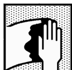
Dynacoat Uni Degreaser